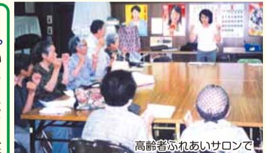
▲ゆ〜みんクラブ主催、親善ベタンク大会。 高齢者ふれあいサロンで 戦後の混乱期から、日本の繁栄を支えたおとしよりに、住み慣れた土地で自分らしい老後を送って欲しい。それが私の願いです。