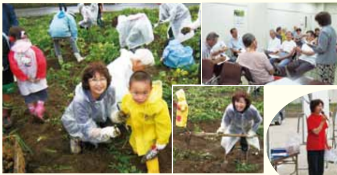
▲農業委員会によるいもほり。多数の子供も参加しました。私もクワを持ち「どっこいしょ!!」